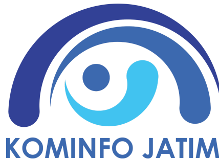
Gambar 2.1 Logo Diskominfo Jawa Timur

Dinas Komunikasi dan Informatika (Diskominfo) Provinsi Jawa Timur merupakan perangkat daerah yang memiliki tugas pokok dan fungsi dalam bidang komunikasi, informatika, persandian, dan statistik. Diskominfo Jawa Timur berperan penting dalam mendukung pembangunan daerah melalui pemanfaatan teknologi informasi dan komunikasi (TIK), serta penyebarluasan informasi publik yang cepat, tepat, dan transparan. Sebagai garda terdepan dalam penyelenggaraan komunikasi pemerintahan dan pelayanan informasi publik, Diskominfo Jawa Timur berkomitmen untuk menciptakan sistem pemerintahan yang terbuka dan akuntabel berbasis teknologi digital.