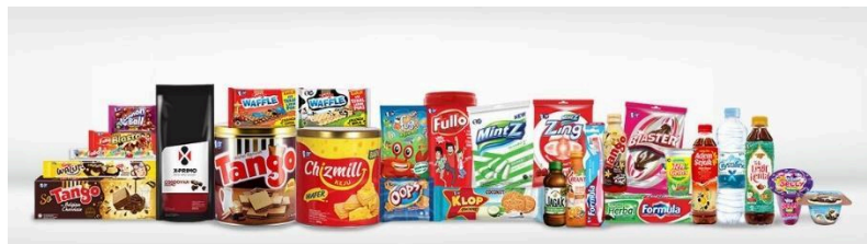
Gambar 2.2 Produk Orang Tua Group

Orang Tua (OT) merupakan perusahaan yang telah menapaki perjalanan panjang sejak berdirinya pada tahun 1948 sebagai produsen minuman kesehatan tradisional di Indonesia. Seiring dengan tingginya antusiasme masyarakat terhadap produk OT, perusahaan ini dengan cepat memperluas operasionalnya melalui pendirian pabrik pertama di Semarang, yang kemudian disusul dengan pabrik kedua di Jakarta. Memasuki tahun 1984, OT mulai melakukan diversifikasi ke sektor barang konsumsi (consumer goods) dengan meluncurkan produk perawatan diri seperti pasta gigi dan sikat gigi di bawah merek FORMULA. Tahun berikutnya, mereka membentuk holding company bernama ADA yang bertugas mengelola berbagai unit usaha dan fasilitas produksi yang terus berkembang. Langkah ini menjadi fondasi penting dalam ekspansi bisnis OT di berbagai lini produk.