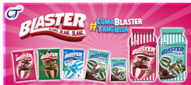
Gambar 2.7 Produk Blaster

Blaster adalah produk permen inovatif dari PT Ultra Prima Abadi yang menggabungkan lapisan luar permen keras dengan isian coklat lembut di dalamnya. Dikenal dengan tagline “Blang... Blang... Blang...”, permen ini menampilkan motif belang atau garis-garis warna