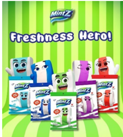
Gambar 2.5 Produk Mintz

MintZ adalah salah satu produk unggulan dari PT Ultra Prima Abadi yang berbentuk permen karet lunak dengan sensasi rasa mint yang menyegarkan. Produk ini hadir dengan tekstur kenyal yang memberikan pengalaman mengunyah yang menyenangkan, serta diperkaya dengan kombinasi rasa buah dan mint yang unik. MintZ memiliki berbagai varian rasa seperti Doublemint, Peppermint, Grapemint, Lemonmint, dan Cherrymint, yang masing-masing dikemas dengan desain warna yang menarik dan mudah dibedakan. Setiap variannya menawarkan perpaduan rasa yang khas, mulai dari segar klasiknya peppermint hingga manisnya buah seperti anggur, lemon, dan ceri yang berpadu dengan dinginnya mint. Permen ini dikemas secara praktis sehingga mudah dibawa dan dikonsumsi kapan saja, menjadikannya pilihan yang tepat bagi konsumen aktif yang membutuhkan kesegaran instan. Dengan keunggulan rasa, kemasan, dan tekstur, MintZ mampu menarik perhatian konsumen muda hingga dewasa dan telah menjadi salah satu produk permen yang cukup dikenal di pasaran Indonesia.