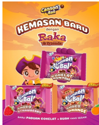
Gambar 2.6 Produk Cannon Ball

Cannon Ball Coklat Kunyah adalah produk permen dari PT Ultra Prima Abadi yang menawarkan sensasi unik melalui perpaduan rasa coklat yang lezat dengan tekstur yang kenyal. Permen ini berbentuk bulat dengan balutan coklat yang menggoda di bagian luar dan isian lembut di dalamnya, menciptakan pengalaman mengunyah yang nikmat dan memuaskan. Dengan rasa manis khas cokelat serta tekstur chewy, Cannon Ball Coklat Kunyah sangat cocok dinikmati oleh berbagai kalangan, mulai dari anak-anak hingga orang dewasa. Kemasan produk didesain dengan warna coklat yang mencolok dan elemen visual dinamis, mencerminkan kesan energik dan menyenangkan dari permen ini. Cannon Ball Coklat Kunyah menjadi pilihan tepat bagi konsumen yang mencari camilan praktis dengan rasa coklat yang kaya dan tekstur yang berbeda dari permen biasa.