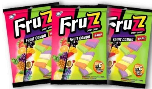
Gambar 2.8 Produk Fruzz

Fruzz adalah permen kunyah (chewy candy) beraroma buah yang diproduksi oleh PT Ultra Prima Abadi dengan konsep rasa yang segar dan menyenangkan. Mengusung varian Fruit Combo, Fruzz menghadirkan kombinasi rasa buah-buahan tropis seperti jeruk, anggur, nanas, stroberi, dan lainnya dalam satu kemasan. Setiap permen dikemas dengan warna cerah dan menarik, sesuai dengan cita rasa buah yang diwakilinya. Desain kemasannya pun penuh warna dengan gradasi merah muda dan hijau cerah, mencerminkan kesegaran dan keceriaan yang ditawarkan produk ini. Fruzz juga diperkaya dengan Vitamin C, menjadikannya tidak hanya enak dikonsumsi, tetapi juga memberikan manfaat tambahan bagi tubuh. Teksturnya yang kenyal dan rasa buahnya yang kuat menjadikan Fruzz pilihan ideal sebagai camilan ringan yang menyegarkan di berbagai suasana, terutama bagi kalangan muda yang aktif dan menyukai sensasi permen yang playful.