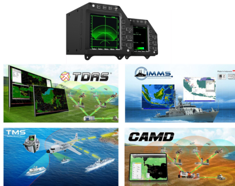
Gambar 2. 2 Produk PT Infoglobal Teknologi Semesta

Seiring berkembangnya teknologi dan kebutuhan operasional militer yang semakin kompleks, Infoglobal memperluas kapabilitasnya dengan merancang sistem berbasis C4ISR ( Command, Control, Communications, Computers, Intelligence, Surveillance, and Reconnaissance ). Produk-produk unggulan seperti Tactical Display Air Situation (TDAS), Integrated Monitoring and Management System (IMMS), serta Tactical Mission System (TMS) menjadi bagian penting dari sistem pemantauan lalu lintas udara dan kendali operasi militer. Sistem ini mampu mengintegrasikan data radar sipil dengan militer secara real-time , serta mendukung pengambilan keputusan yang cepat dan akurat dalam konteks pertahanan nasional.