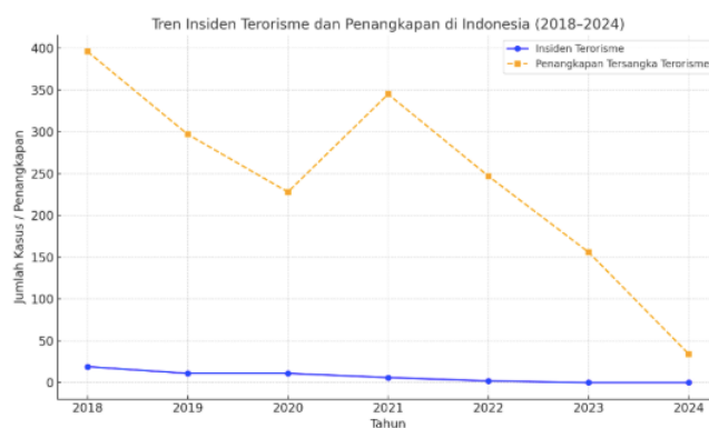
Gambar 1. 1 Grafik Terorisme & Penangkapan

nasional Indonesia melalui diterbitkannya Undang-Undang Nomor 5 Tahun 2018 tentang Pemberantasan Tindak Pidana Terorisme, yang memperluas mandat negara dalam pencegahan, penindakan, dan penanggulangan terorisme secara lebih komprehensif. Melalui perjanjian ini kedua negara meningkatkan berbagai aktivitas kontra-terorisme yang bersifat preventif maupun responsif.