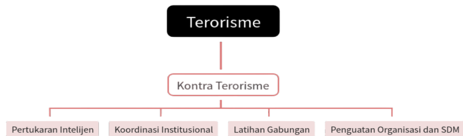
Gambar 1. 2 Bagan Sintesa

Dalam menggambarkan hubungan antara ancaman terorisme dan upaya penanggulangannya, penulis menggunakan perspektif Bruce Hoffman untuk memahami bagaimana negara merespons bahaya terorisme yang semakin kompleks, lintas batas, dan berupaya menciptakan ketakutan luas di tengah masyarakat. Melalui kerangka Hoffman, penulis melihat bahwa penanggulangan terorisme bukanlah upaya tunggal, melainkan serangkaian tindakan yang saling berhubungan mulai dari pentingnya melakukan pertukaran intelijen, koordinasi yang solid antar-lembaga, latihan bersama, hingga penguatan kualitas sumber daya manusia dan organisasi keamanan. Keempat unsur ini digunakan penulis dengan alasan bahwa seluruhnya menggambarkan bagaimana negara seharusnya bergerak secara terpadu dan berkelanjutan dalam menghadapi ancaman teror.