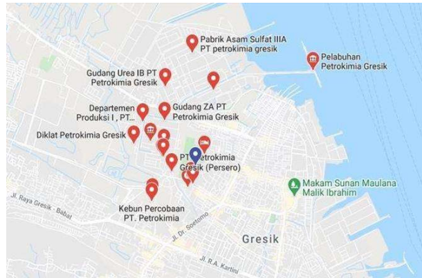
Gambar I. 2 Peta Lokasi PT. Petrokimia Gresik