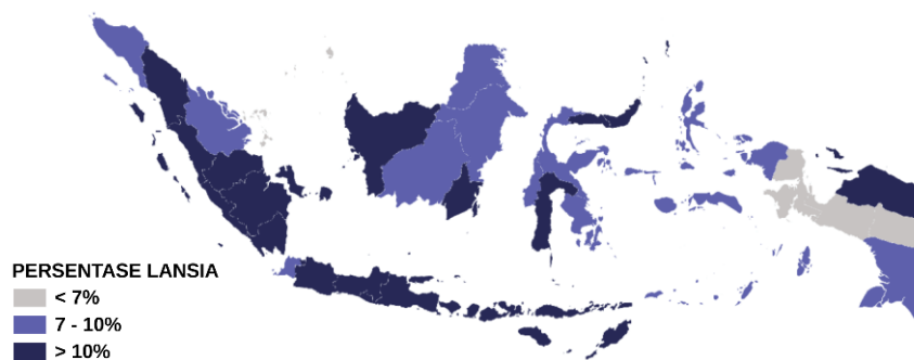
Gambar 1.2 Persentase Lansia Menurut Provinsi Tahun 2024

Berdasarkan laporan Badan Pusat Statistik (BPS) pada tahun 2024 mengenai persentase lansia menurut provinsi, Jawa Timur menempati posisi kedua tertinggi setelah DI Yogyakarta, dengan persentase lansia mencapai 16,02%, menandakan provinsi ini sedang memasuki fase struktur penduduk tua. Kondisi ini menegaskan perlunya perhatian khusus terhadap risiko jatuh pada lansia di Jawa Timur, mengingat tingginya populasi lansia dan dampak signifikan jatuh terhadap kemandirian serta kualitas hidup lansia.