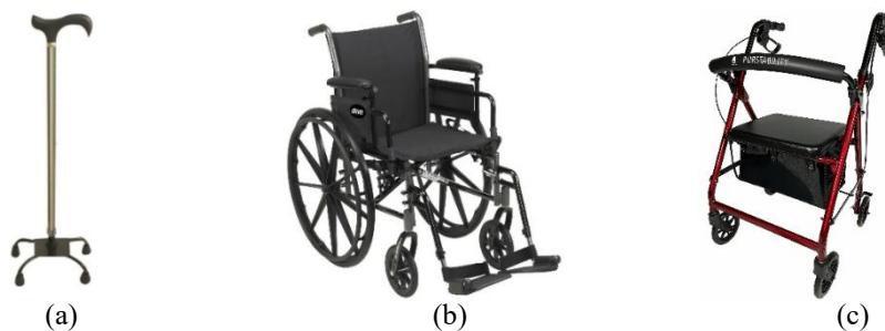
Gambar 1.3 (a) Tongkat, (b) Kursi Roda, (c) Rollator Walker