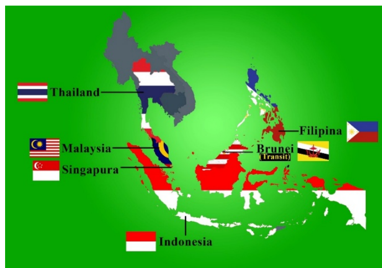
Gambar 1.1 Peta Sebaran JI di Asia Tenggara

Terorisme transnasional merupakan salah satu ancaman serius yang dapat mengganggu stabilitas keamanan nasional maupun regional, termasuk Indonesia. Jemaah Islamiyah (JI) sebagai jaringan teror yang beroperasi di Asia Tenggara, khususnya di beberapa negara utama seperti Indonesia, Malaysia, Filipina, dan Singapura. JI adalah sebuah organisasi Islam radikal yang didirikan sekitar tahun 1992–1993 oleh Abdullah Sungkar dan Abu Bakar Ba'asyir ketika keduanya berada di Malaysia. Keduanya merupakan veteran dari gerakan Darul Islam dan pendiri Pesantren Al Mukmin di Ngruki, Solo, pada tahun 1972. Tujuan utama dari organisasi ini adalah untuk menjadikan Indonesia sebagai negara Islam, dan dalam jangka panjang, mewujudkan kekhalifahan Islam di kawasan Asia Tenggara yang mencakup Malaysia, Thailand Selatan, Brunei Darussalam, dan Filipina Selatan.