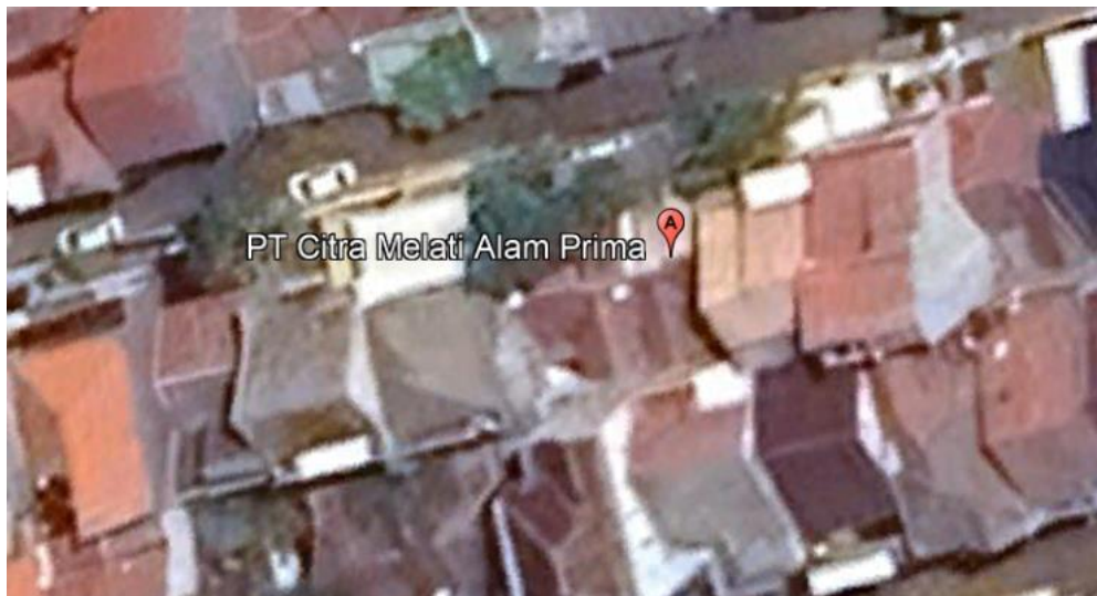
Gambar 2. 1 Lokasi Pelaksanaan Kegiatan Magang

Lokasi pelaksanaan kegiatan magang berada di PT Citra Melati Alam Prima yang terletak di Jl. Kalisari Dharma IV No.26, Kalisari, Kec. Mulyorejo, Surabaya, Jawa Timur 60112. Lokasi kegiatan magang merupakan salah satu perusahaan jasa yang bergerak di bidang konsultan lingkungan. Berikut merupakan lokasi pelaksanaan kegiatan magang jika di proyeksikan dari Google Earth seperti yang ditampilkan pada Gambar 2. 1 .