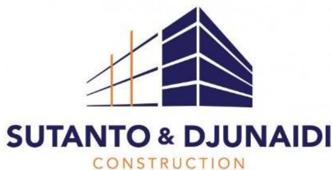
Gambar 2.1. Logo perusahaan PT Sutanto Konstruksi