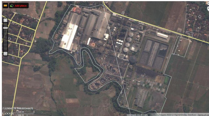
Gambar I. 1 Lokasi Industri

PT Indo Acidatama Tbk. terletak di desa Kemiri, kecamatan Kebakkramat, kabupaten Karanganyar, Surakarta, Jawa Tengah. Penampakan atas PT Indo Acidatama Tbk. dapat dilihat pada Gambar I.1.