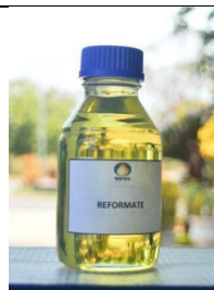
Gambar I. 13 Produk Reformate