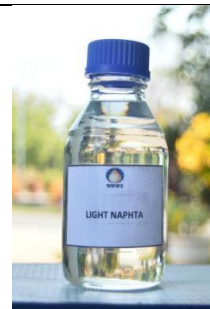
Gambar I. 12 Produk Light Naphta