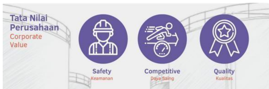
Gambar I. 5 Budaya dan Tata Nilai Perusahaan PT TPPI

Budaya Perusahaan adalah perpaduan Tata Nilai Perusahaan dan keyakinan – keyakinan yang tercermin dalam perilaku keseharian, sistem & proses, dan