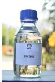
Gambar I. 15 Produk Benzene