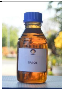
Gambar I. 11 Produk Gas Oil