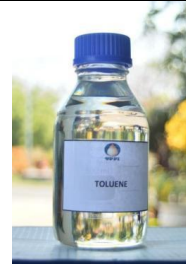
Gambar I. 16 Produk Toluene