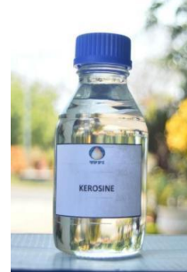
Gambar I. 10 Produk Kerosene