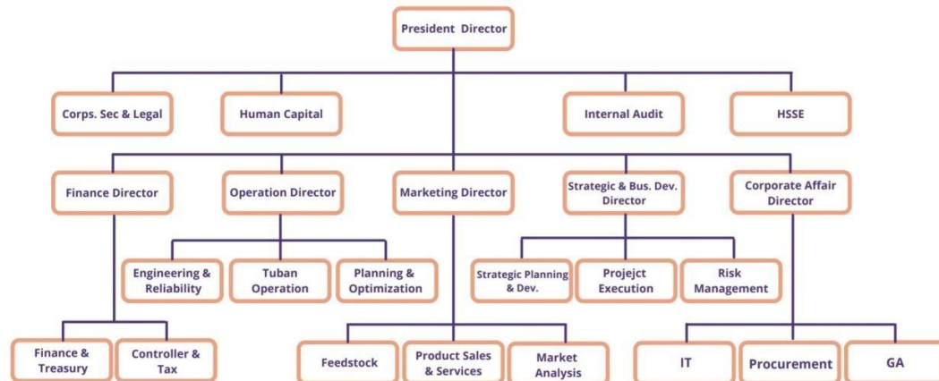
Gambar I. 6 Struktur Organisasi Perusahaan PT TPPI

Berikut Struktur Organisasi (SO) PT TPPI