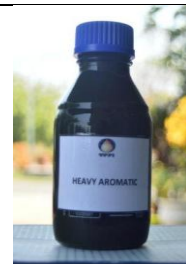
Gambar I. 18 Produk Heavy Aromatik