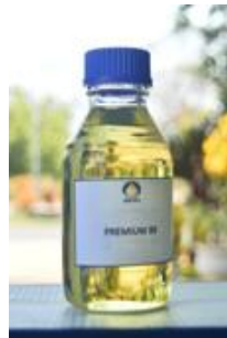
Gambar I. 9 Produk Premium