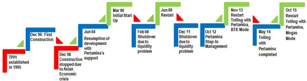
Gambar I. 2 Milestone Perusahaan PT TPPI