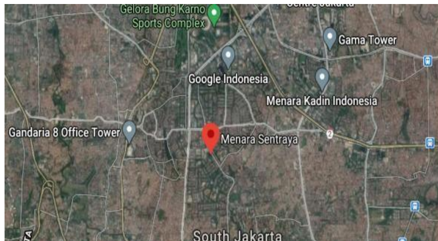
Gambar I. 3 Peta Lokasi Head Office Jakarta PT TPPI