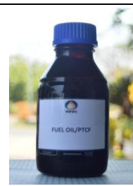
Gambar I. 14 Produk Fuel Oil/PTCF