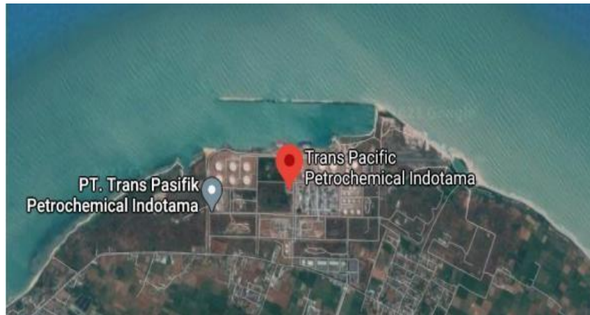
Gambar I. 4 Peta Lokasi Plant PT TPPI Tuban

Jl. Tanjung Awar – awar, Desa Remen – Tasikharjo, Jenu, Kab. Tuban 62352 Telp. +62 356-491031