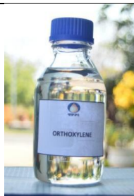
Gambar I. 17 Produk Orthoxylene