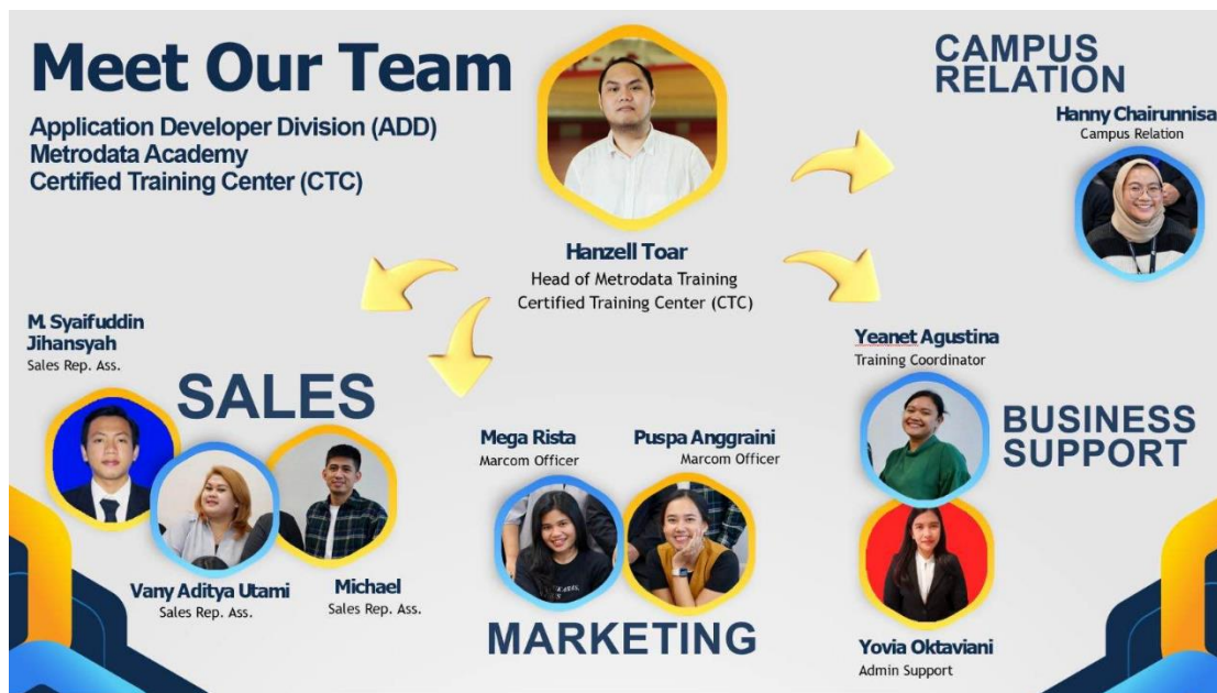
Gambar 2.2 Struktur Organisasi II

Struktur organisasi dari Certified Training Center (CTC) di PT Sinergi Transformasi Digital dirancang untuk mendukung operasi pelatihan dan pengembangan yang efisien. Pada puncak struktur ini adalah Head of Metrodata Training, yang bertanggung jawab atas keseluruhan pengelolaan dan pengembangan program pelatihan. Di bawah Head of Metrodata Training, terdapat empat posisi kunci yang masing-masing mengurus area spesifik: Sales, yang fokus pada penjualan program pelatihan dan pengembangan hubungan dengan klien; Marketing, yang bertugas merancang dan mengimplementasikan strategi pemasaran untuk mempromosikan program-program pelatihan; Campus Relation, yang bertanggung jawab untuk membangun dan memelihara hubungan dengan institusi pendidikan dan komunitas akademik; dan Business Support, yang menyediakan dukungan operasional dan administrasi untuk memastikan kelancaran kegiatan di Certified Training Center. Struktur ini memastikan bahwa setiap aspek penting dari operasional pelatihan tertangani dengan baik, sehingga CTC dapat memberikan layanan pelatihan yang berkualitas tinggi.