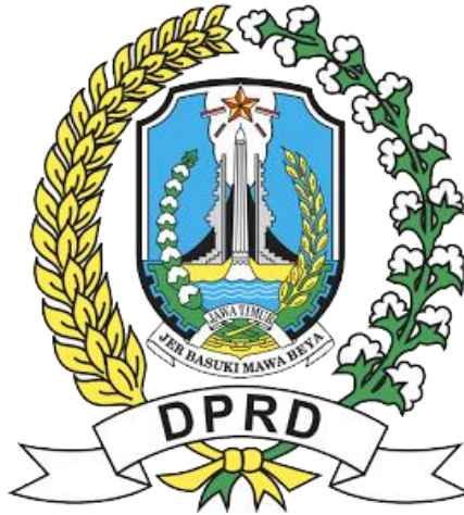
Gambar 2. 1 Logo DPRD Provinsi Jawa Timur

Sejarah DPRD Provinsi Jawa Timur dimulai pada tahun 1950 dengan terbentuknya Provinsi Jawa Timur sebagai Daerah Swatantra berdasarkan UU No. 2 Tahun 1950. Pada masa awal, DPRD Jawa Timur berfungsi sebagai lembaga perwakilan rakyat dengan tugas membantu gubernur dalam menyelenggarakan pemerintahan. Struktur dan peran DPRD Jawa Timur mengalami berbagai perubahan sepanjang sejarah, terutama dalam masa-masa penting seperti Orde Lama, Orde Baru, dan Reformasi.