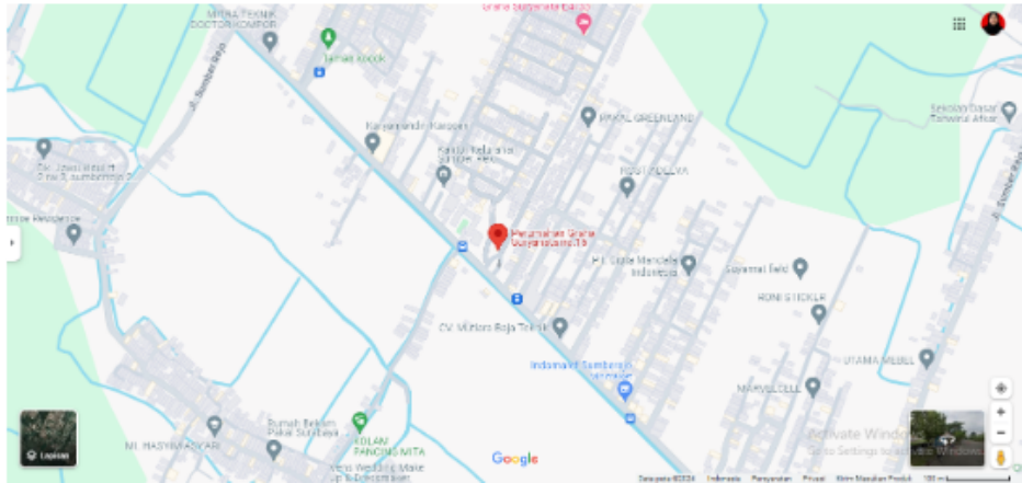
Gambar 2.5 Lokasi Instansi BeData Technology Indonesia

CV.Bedata Technology berlokasi di PERUM IKIP GUNUNG ANYAR G-, Surabaya, Jawa timur, Indonesia