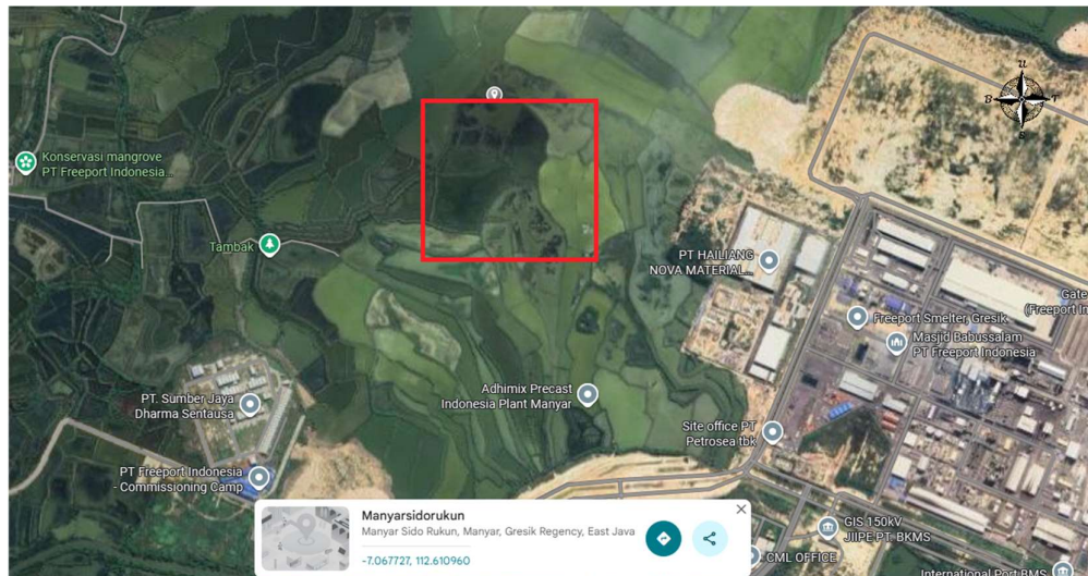
Gambar I. 2 Lokasi Pendirian Pabrik Natrium Tripolifosfat

Peta lokasi yang digunakan untuk pendirian pabrik ditunjukkan pada Gambar I.2 sebagai berikut :