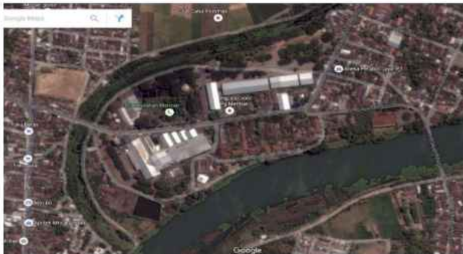
Gambar 1.2 Peta Lokasi PT Sinergi Gula Nusantara PG Meritjan Kediri