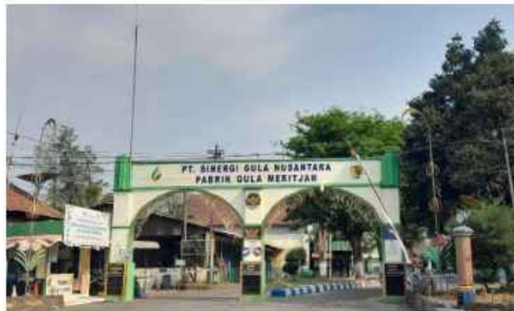
Gambar 1. 1 Foto PT. Pabrik Gula Meritjan

Pabrik Gula Meritjan adalah salah satu dari 11 unit usaha industri dibawah naungan PTPN X yang memiliki kegiatan mengolah bahan baku tebu menjadi produk gula putih dengan kualitas SHS (Superior High Sugar) . Pabrik Gula Meritjan bertujuan untuk memenuhi kebutuhan gula nasional atau dalam negeri serta menyongsong tercapainya program swasembada gula melalui akselerasi peningkatan produktivitas. Disamping itu, Pabrik Gula Kota Kediri juga menghasilkan produk samping berupa tetes tebu yang merupakan bahan baku pembuatan penyedap rasa dan alkohol. Pada akhir tanggal 10 Oktober 2022, telah dilakukan pengalihan PTPN X kedalam PT SGN (Sinergi Gula Nusantara). Dasar perubahan ini adalah Keputusan Menteri Hukum dan HAM RI No AHU-00729.AH.01.02 Tentang Persetujuan Perubahan Anggaran Dasar Perseroan Terbatas PT. Sinergi Gula Nusantara.