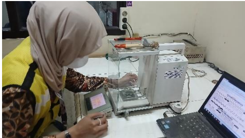
Gambar 1. Menimbang Sampel Untuk Analisis Kadar Air