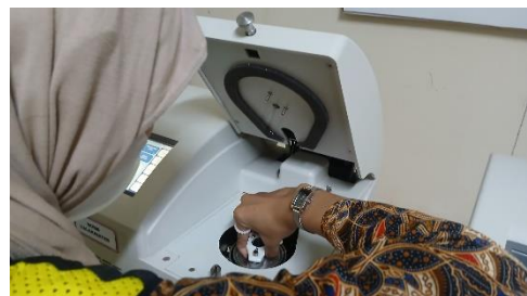
Gambar 6. Mengoperasikan Alat Bom kalorimeter