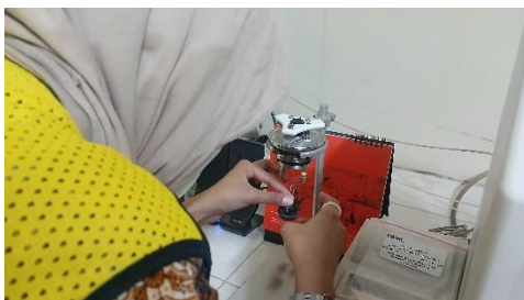
Gambar 5. Merangkai Alat Untuk Uji Bom Kalorimeter