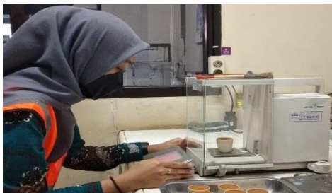
Gambar 3. Menimbang Sampel Untuk Analisis Kandungan Abu