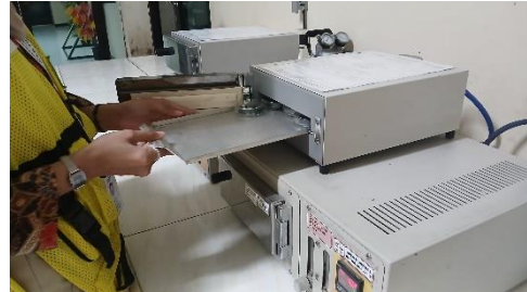
Gambar 2. Memasukkan Sampel yang telah ditimbang ke dalam oven