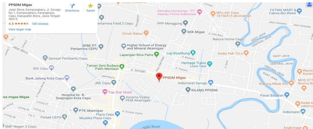
Gambar I.1 Peta Lokasi PPSDM Migas Cepu

Pusat Pengembangan Sumber Daya Manusia Minyak dan Gas Bumi berlokasi di Jalan Sorogo 1, Kelurahan Karangboyo, Kecamatan Cepu, Kabupaten Blora, Provinsi Jawa Tengah, Kode pos 58315. Luas area sarana dan prasarana seluas 129 hektar.