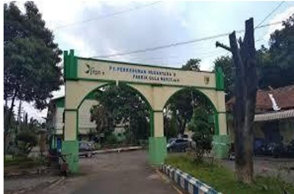
Gambar I. 2 Foto PT. Pabrik Gula Meritjan