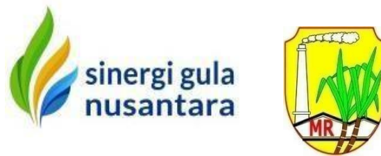
Gambar I. 1 Logo PT Sinergi Gula Nusantara dan PG. Meritjan