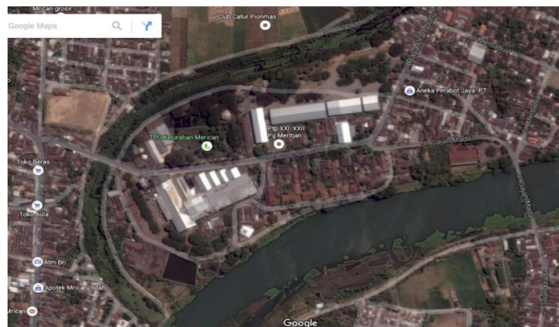
Gambar I. 4 Peta Lokasi PT. Sinergi Gula Nusantara PG.

Pabrik Gula Meritjan berlokasi \pm 5 km sebelah utara kota Kediri, tepatnya di Jalan Merbabu RT. 005 RW. 007, Kelurahan Mrican, Kecamatan Mojoroto, Kota Kediri, Jawa Timur.