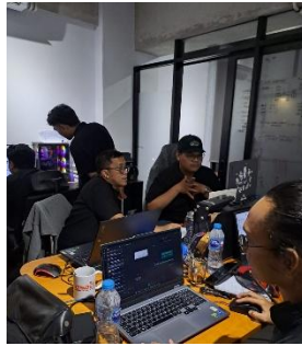
Gambar 1. 2 Kondisi kantor PT Arunowo Reka Utama

PT. Arunowo Reka Utama lebih memiliki fokus pada pengembangan desain arsitektur yang bertema kontekstual, berkelanjutan dan inovatif. PT. Arunowo Reka Utama sudah menghasilkan banyak karya-karya arsitektur yang bervisualisasi estetis, fungsional dan responsif. Perusahaan Arunowo berspesialis pada rancangan bangunan komersial, fasilitas Pendidikan, Gedung pemerintah, hunian dan Kawasan terpadu. PT. Arunowo Reka Utama lebih mengutamakan sistem kolaborasi dalam mengerjakan dan menyelesaikan proyeknya. Beberapa pihak akan di gaet dan diajak berkolaborasi untuk membentuk hasil kerja yang maksimal. Pihak kolaboratornya ialah seperti pihak dari struktural, Studio arsitek lainnya dan teknisi-teknisi yang berkompeten dibidangnya.