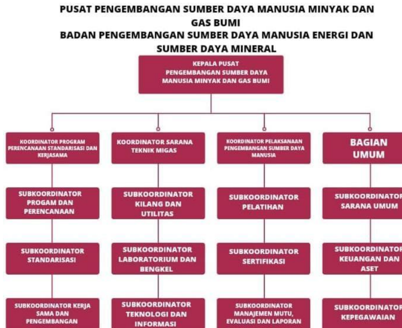
Gambar I. 2 Struktur Organisasi PPSDM MIGAS Cepu