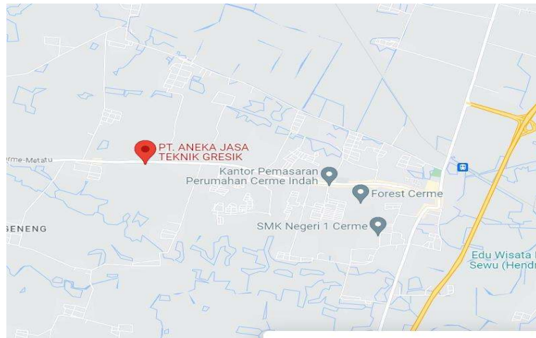
Gambar 2 1 Lokasi Perusahaan berdasarkan penampilan dari peta.

Pelaksanaan kegiatan magang MBKM – ISS yang bertepat di PT. Aneka Jasa Teknik yang beralamatkan di jalan raya dungus cerme km 3 Gresik – Jawa Timur.