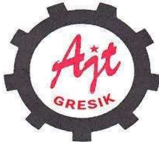
Gambar 2 3 Logo Perusahaan PT. Aneka Jasa Teknik Gresik