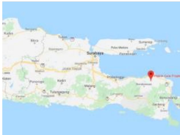
Gambar II.4 Peta PT. Sinergi Gula Nusantara, PG Pradjekan