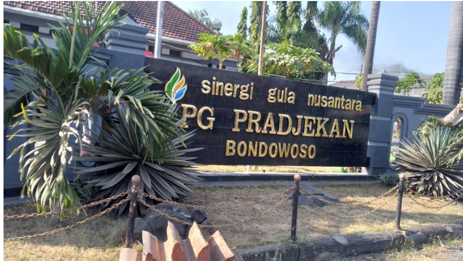
Gambar II. 1. Pabrik Gula Pradjekan

PG Pradjekan didirikan pada tahun 1883 oleh perusahaan Belanda NV Cultuur Mij yang merupakan investasi dari "JW Barnie Anment dan Co" Surabaya, dengan luas areal sekitar 950 Ha dan kapasitas giling \pm 270 ton perhari. Kata "Pradjekan" diambil dari nama daerah tempat berdirinya pabrik itu sendiri. Pada tahun 1909 PG Pradjekan diambil alih oleh Cultuur Handle en Industry Bank dan terpaksa menghentikan produksinya pada masa kependudukan Jepang. PG Pradjekan mulai dirintis kembali oleh pemiliknya setelah revolusi berakhir. Pada tanggal 10 November 1957 PG Pradjekan diambil alih oleh Pemerintah Republik Indonesia sebagai perwujudan nasionalisasi perusahaan Belanda di Indonesia. PG Pradjekan diambil alih dan pengolahannya diserahkan kepada Pusat Perkebunan Negara Baru (PPN Baru). Dalam rangka ambil alih tersebut pemerintah mengeluarkan Undang-Undang Nasional pada tahun 1959 dan menetapkan PG Pradjekan dibawah PPN unit Jawa Timur Rayon VIII (UU No.26/ 1959). Pada tahun 1960 diadakan reorganisasi dalam tubuh PPN Baru yaitu dengan dibentuknya praunit-praunit yang kemudian menjadi unit-unit rayon. PG Pradjekan termasuk dalam unit gula B. Untuk mengukuhkan unit tersebut menjadi badan hukum maka