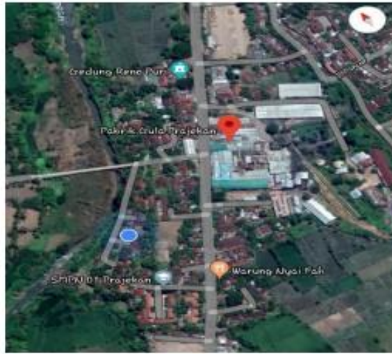
Gambar II.3 Foto Satelit PT. Sinergi Gula Nusantara, PG Pradjekan