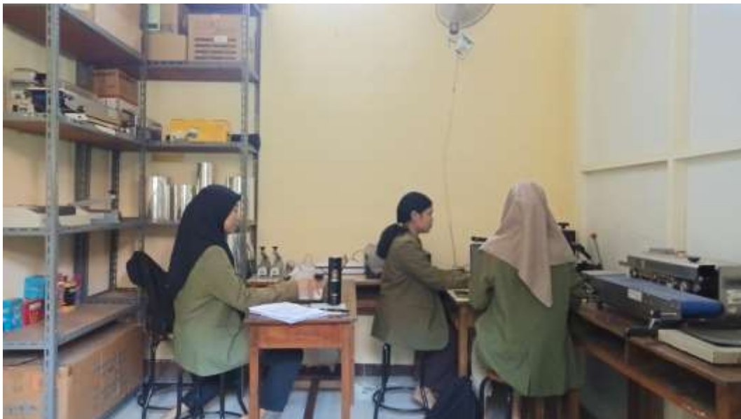
Proses pengerjaan tugas PKL