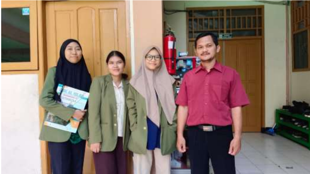
Perkenalan dengan pembimbing lapangan

Kegiatan PKL dilaksanakan pada SMK Al Islah Surabaya yang dilaksanakan selama 1 bulan terhitung sejak 25 September 2023 sampai 25 Oktober 2023. Kegiatan PKL ini dilakukan secara luring.