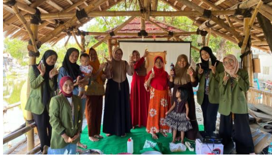
Gambar 2. Demonstrasi Pembuatan Spray Anti-Nyamuk dari Serai Wangi

Respon ini menunjukkan bahwa masyarakat tidak hanya menerima produk ini sebagai solusi untuk mengatasi masalah nyamuk, tetapi juga sebagai cara untuk mengurangi ketergantungan pada bahan kimia yang seringkali memiliki dampak lingkungan dan kesehatan. Keberhasilan kegiatan ini juga membuka peluang untuk pengembangan lebih lanjut dalam pemanfaatan bahan-bahan alami lokal, yang dapat meningkatkan kualitas hidup dan kesehatan masyarakat secara berkelanjutan.