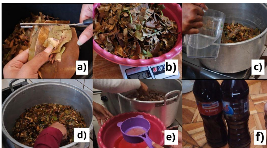
Gambar 3. Proses Pembuatan Pewarna Tekstil Alami dari Daun Mangrove

Proses pewarnaan dilakukan dengan metode perendaman kain dalam larutan pewarna yang telah diekstraksi. Cara mordanting kain sebelum diwarnai adalah dengan merendam kain ke dalam larutan deterjen selama 20 menit dengan perbandingan 4 gram untuk tiap liter air. Setelah direndam kain dicuci dan diperas dengan hati-hati kemudian merebus kain dengan air mendidih dan dicampurkan dengan 6,7 gram tawas dan 2 gram soda abu ke dalam 1 liter air. Membiarkan air tetap di dalam wadah dan matikan api, tunggu sampai benar-benar dingin dan cuci kain dengan air bersih, selanjutnya kain dijemur dengan cara diangin-anginkan hingga kain siap dicelup dalam pewarna alami. Langkah pewarnaan dilakukan dengan merebus larutan pewarna sebelum mendidih dimatikan, memasukkan kain yang akan diwarnai, menekan dan mengangkat serta mengulangi hal tersebut beberapa kali agar warna merata kemudian diperas dan didinginkan. Setelah proses pewarnaan, kain diuji ketahanannya terhadap pencucian dan paparan sinar matahari untuk memastikan bahwa warna yang dihasilkan stabil dan tidak mudah pudar.