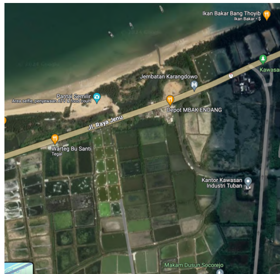
Gambar I. 3 Lokasi Pabrik

Faktor utama yang mempengaruhi dalam pemilihan lokasi dan tata letak pabrik antara lain: