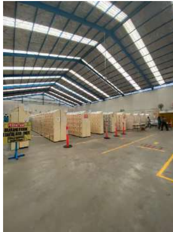
Gambar 1. 9 Fasilitas loker barang karyawan