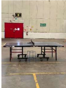
Gambar 1. 4 Fasilitas olahraga