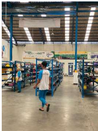
Gambar 1. 10 Fasilitas loker makanan karyawan