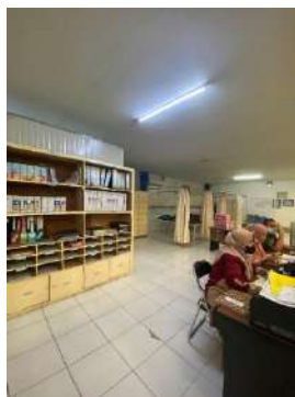
Gambar 1. 6 Fasilitas klinik