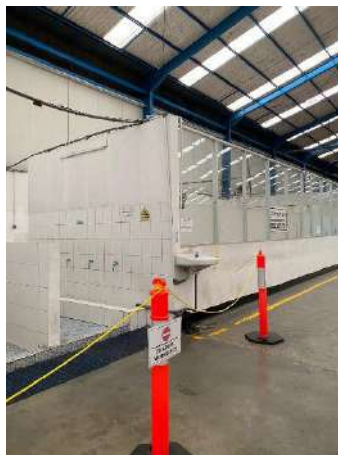
Gambar 1. 8 Fasilitas mushola