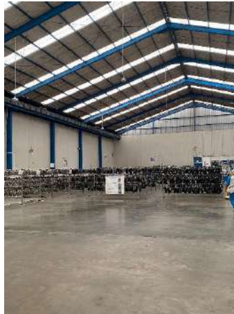
Gambar 1. 11 Fasilitas loker sepatu karyawan