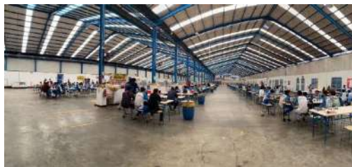
Gambar 1. 5 Fasilitas kantin