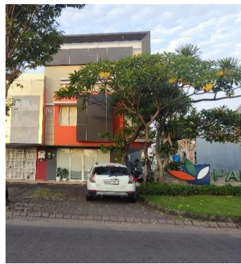
Gambar 1. 1 Foto gedung kantor PT. Tata Matra Indonesia

Saat ini PT. Tata Matra Indonesia tidak memiliki kantor cabang dan berpusat pada kota Surabaya. Lokasi kantor berada pada Sandiego Parkway MP2/1 No.58, Pakuwon City, Mulyorejo, Kota Surabaya, Jawa Timur, 60112. Bentuk fisik kantor berupa ruko 3 lantai yang terketak pada area komersil Pakuwon City.