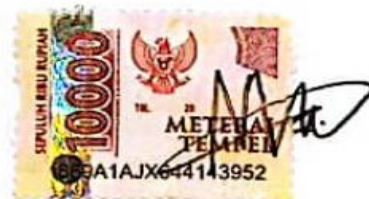
Ric Mayang Irawati Irtan Putri

Surabaya, 13 September 2024 Yang Menyatakan,