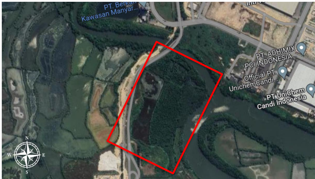
Gambar I. 2 Lokasi Pendirian Pabrik Tributil Sitrat