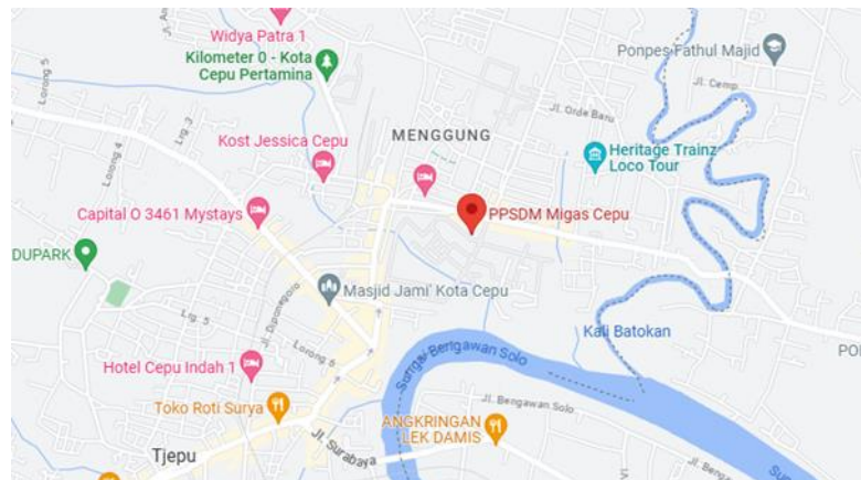
Gambar I. 1 PPSDM Migas Cepu

PPSDM Migas berlokasi di jalan Sorogo No.1 Kecamatan Cepu, Kabupaten Blora, Jawa Tengah dengan luas area sarana dan prasarana Pendidikan serta pelatihan sekitar 129 hektar