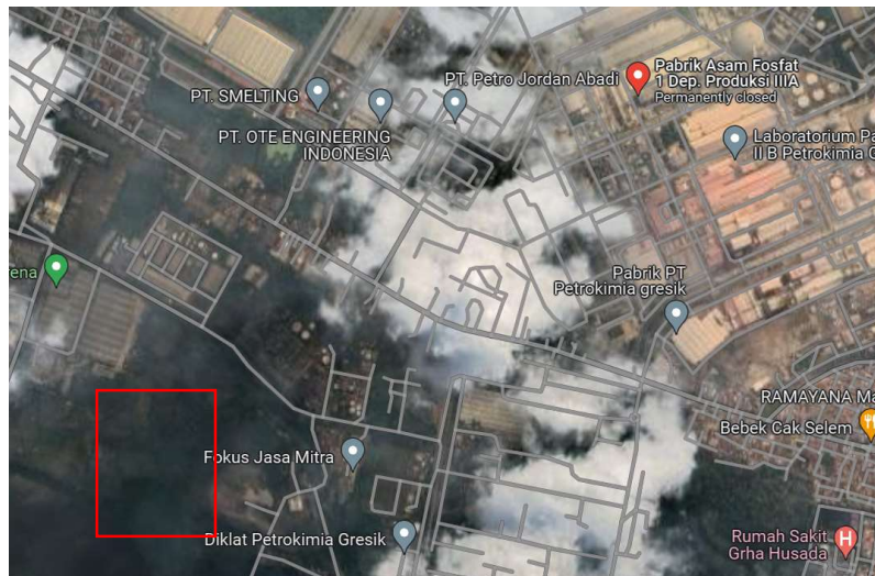
Gambar I. 2 Lokasi Pabrik

Pemilihan lokasi pabrik merupakan salah satu masalah pokok dalam menunjang keberhasilan suatu pabrik, terutama pada aspek-aspek ekonomisnya. Sebuah pabrik hendaknya memiliki lokasi yang strategis sehingga biaya produksi dan distribusinya dapat dioptimalkan. Setelah mempelajari dan mempertimbangkan beberapa faktor yang mempengaruhi pemilihan lokasi pabrik, maka ditetapkan lokasi pabrik Dinatrium Fosfat ini akan didirikan di Kawasan Industri Gresik, Kecamatan Gresik, Kabupaten Gresik, Jawa Timur.