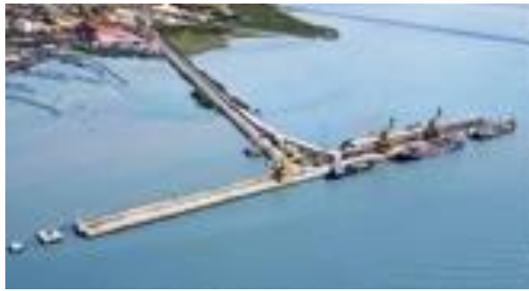
Gambar 1.5 Fasilitas Dermaga PT. Petrokimia Gresik

Loading Crane yang dapat memuat hasil produksi ke kapal dalam bentuk curah dengan kapasitas 300 ton/jam. Fasilitas lainnya adalah dua buah Cangaroo crane yang merupakan alat bongkar curah dengan kapasitas masing-masing 350 ton/jam, serta belt conveyor dengan panjang keseluruhan mencapai 22 km. Dermaga PT Petrokimia Gresik juga dilengkapi fasilitas untuk bongkar muat bahan kimia cair berkapasitas 60 ton/jam untuk Amoniak dan 90 ton/jam untuk Asam Sulfat. Dan juga memiliki dermaga khusus batubara dengan kapasitas bongkar muat mencapai 480.000 ton/tahun.