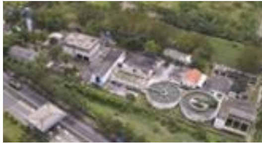
Gambar 17 Unit Pengolahan Limbah