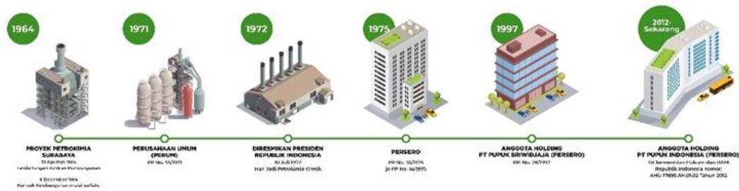
Gambar 1.1 Sejarah Perkembangan PT Petrokimia Gresik

Kemudian pada tanggal 10 Juli 1972 Proyek Petrokimia Surabaya diresmikan oleh Presiden Soeharto dengan bentuk badan usaha PERUSAHAAN UMUM (PERUM). Dan tepat tiga tahun kemudian yaitu pada tanggal 10 Juli 1975 berubah menjadi Perseroan dengan nama PT. PETROKIMIA GRESIK (PERSERO). Pada tahun 1997 berdasarkan PP No.28/1997 dan berdasarkan SK Kementrian Hukum & HAM Republik Indonesia nomor : AHU 17695.AH.01.02 Tahun 2012, PT. Petrokimia Gresik menjadi anggota Holding Company PT Pupuk Indonesia (Persero) sampai saat ini.