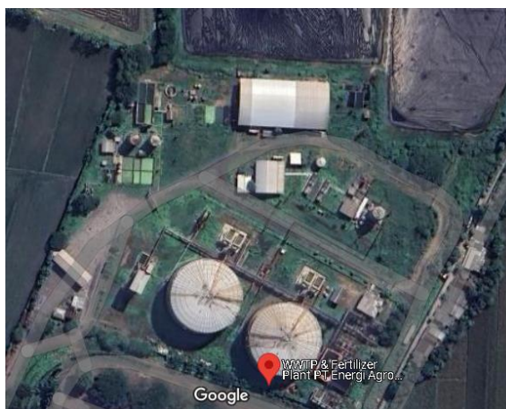
Gambar I.4 Biogas & Fertilizer Plant PT Energi Agro Nusantara