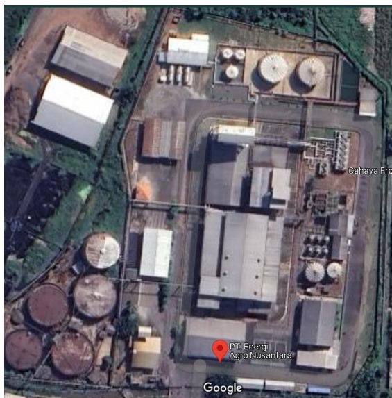
Gambar I.3 Main Process & Head Office PT Energi Agro Nusantara