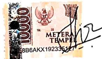
Nemsy Elfa Saputri