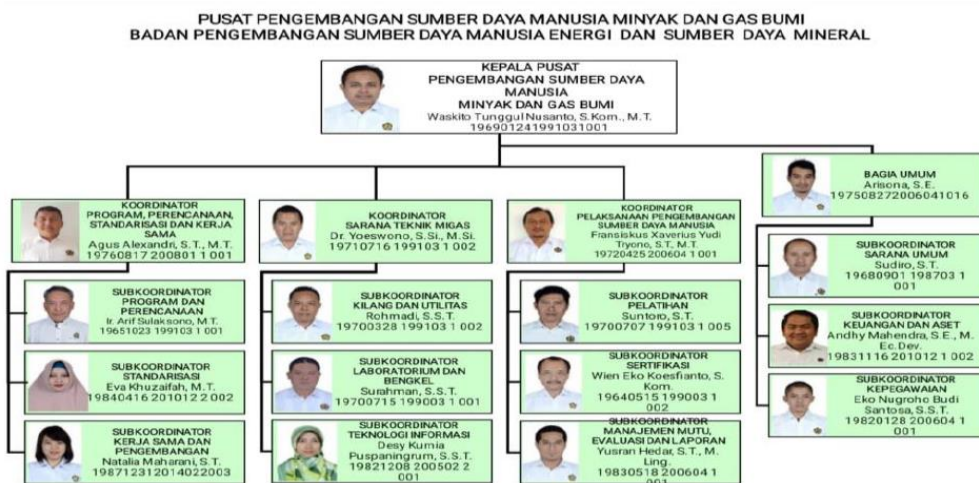
Gambar I. 2 Struktur Organisasi PPSDM Migas Cepu

PPSDM merupakan salah satu instansi pengembangan sumber daya manusia milik pemerintah yang berada di bawah naungan kementerian Energi dan Sumber Daya Mineral. Berikut struktur organisasi PPSDM Migas :