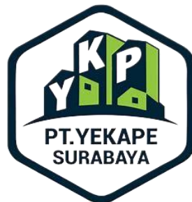
Gambar 2.1. Logo Perusahaan

PT. Yekape Surabaya didirikan pada tanggal 15 Februari 1995 oleh YKP-KMS karena ada perubahan peraturan Pemerintah Kota Surabaya. Seiring berjalannya waktu PT. Yekape saat ini bergerak dengan cakupan yang lebih luas lagi di bidang perumahan untuk Masyarakat Umum terkait kebutuhan rumah dengan Pelayanan Terbaik.