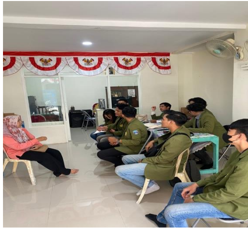
FOTO KEGIATAN PELATIHAN