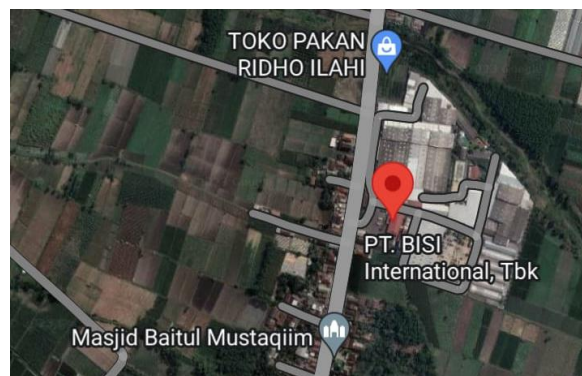
Gambar 3.3. Peta PT. BISI International, Tbk 7^{\circ} 83' 0'' S / 112^{\circ} 17' 0'' E .

PT. BISI International Tbk. merupakan perusahaan yang bergerak dalam kegiatan pembenihan pertanian. Salah satu lokasi produksi dan pengolahan benih BISI terletak di Jl. Raya Wates, Desa Sumberagung, Kecamatan Plosoklaten, Kabupaten Kediri, Jawa Timur.