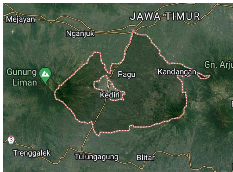
Gambar 3.2. Peta Kabupaten Kediri, 7^{\circ} 49' 0'' S / 112^{\circ} 1' 0'' E..

Wilayah Kabupaten Kediri diapit oleh 5 Kabupaten, yakni di sebelah barat diapit daerah Tulungagung dan Nganjuk, sebelah utara diapit daerah Nganjuk dan Jombang, sebelah timur diapit oleh daerah Jombang dan Malang, dan sebelah selatan diapit oleh daerah Blitar dan Tulungagung. Secara geologis, karakteristik wilayah Kabupaten Kediri dapat diklasifikasikan menjadi 3 (tiga) bagian, yaitu : bagian barat Sungai Brantas, merupakan perbukitan lereng Gunung Wilis dan Gunung Klotok, sebagian besar merupakan daerah kurang subur. Bagian tengah, merupakan dataran rendah yang sangat subur, melintas aliran Sungai Brantas dari selatan ke utara yang membelah wilayah Kabupaten Kediri. Bagian Timur Sungai Brantas, merupakan perbukitan kurang subur yang membentang dari Gunung Argowayang di bagian utara dan Gunung Kelud di bagian selatan.