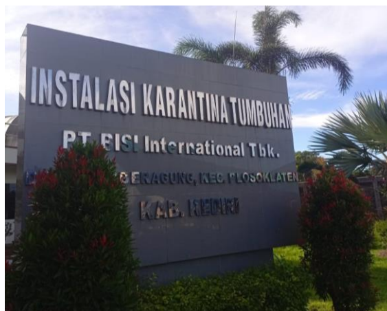
Gambar 3.4. Instalansi Karantina Tumbuhan. (Sumber : Dokumentasi pribadi).

PT. BISI International Tbk. juga memiliki kantor cabang yang berada di Jl. Cokroaminoto No.72 A, Mulyoasri, Tulungrejo, Kec. Pare, Kabupaten Kediri.