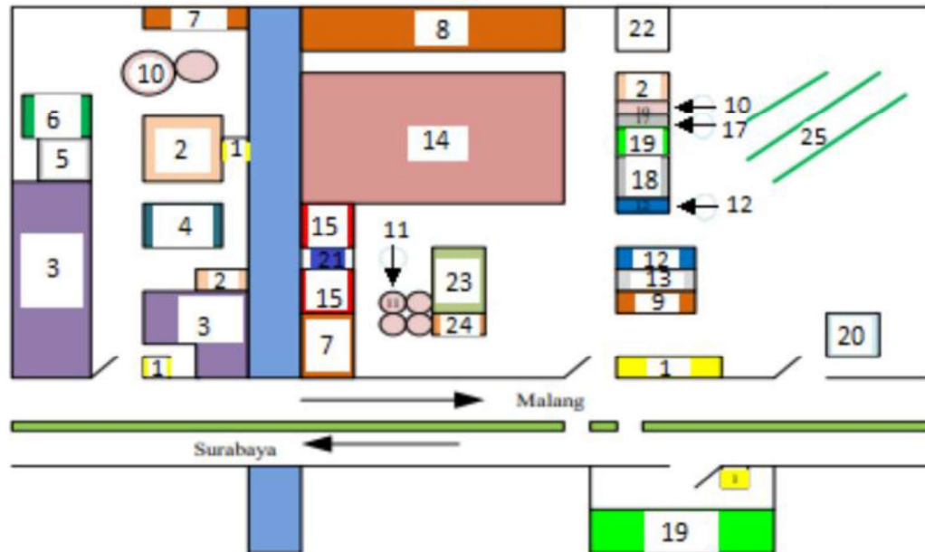
Gambar I.1 Tata Letak Pabrik PT Pabrik Gula Candi Baru