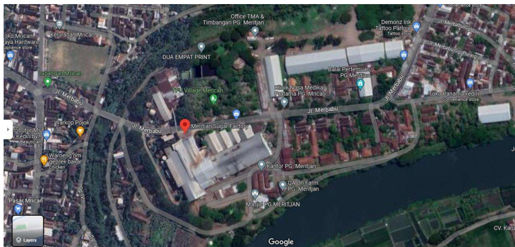
Gambar I.3 Peta Lokasi PT Sinergi Gula Nusantara PG Meritjan Kediri

Pabrik Gula Meritjan berlokasi di Jalan Merbabu RT. 005 RW. 007, Kelurahan Mrican, Kecamatan Mojojoto, Kota Kediri, Jawa Timur. Pabrik Gula Meritjan memiliki luas area sebesar 20.930 m 2 , luas perkantoran sebesar 1.100 m 2 , luas perumahan sebesar 1.450 m 2 , dan luas total sebesar 23.480 m 2 . Jarak Pabrik Gula Meritjan dari pusat Kota Kediri ± 5 km dengan waktu tempuh ± 10 menit.