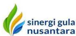
Gambar I.2 Logo PT Sinergi Gula Nusantara