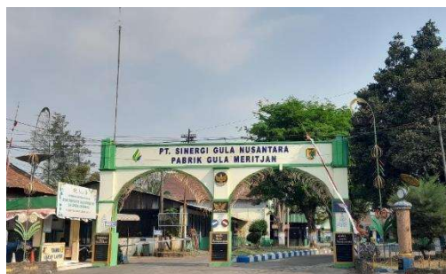
Gambar I.1 Gapura PG Meritjan

Pabrik Gula Meritjan adalah salah satu unit usaha industri di bawah naungan PT Sinergi Gula Nusantara yang memiliki kegiatan mengolah bahan baku tebu menjadi produk gula putih dengan kualitas SHS ( Superior Hoofd Suiker ). Pabrik Gula Meritjan bertujuan untuk memenuhi kebutuhan gula nasional atau dalam negeri serta menyongsong tercapainya program swasembada gula melalui akselerasi peningkatan produktifitas. Pabrik Gula Meritjan PT Perkebunan Nusantara X Kota Kediri juga menghasilkan produk samping berupa tetes tebu yang merupakan bahan baku pembuatan penyedap rasa dan alkohol atau spirtus.