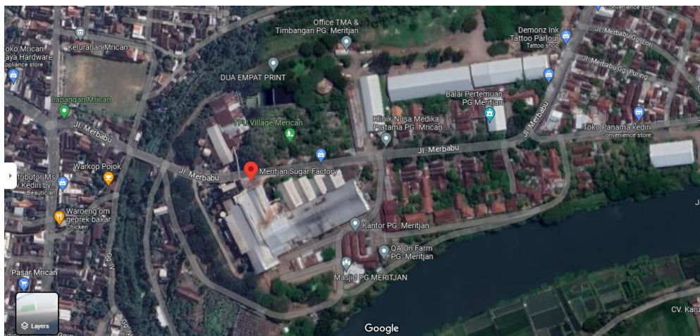
Gambar I.3 Peta Lokasi PT Sinergi Gula Nusantara PG Meritjan Kediri