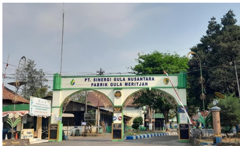
Gambar I.1 Gapura PG Meritjan

Pabrik Gula Meritjan adalah salah satu unit usaha industri di bawah naungan PT Sinergi Gula Nusantara yang memiliki kegiatan mengolah bahan baku tebu menjadi produk gula putih dengan kualitas SHS ( Superior Hoofd Suiker ). Pabrik Gula Meritjan bertujuan untuk memenuhi kebutuhan gula nasional atau dalam negeri serta menyongsong tercapainya program swasembada gula melalui akselerasi peningkatan produktifitas. Pabrik Gula Meritjan PT Perkebunan Nusantara X Kota Kediri juga menghasilkan produk samping berupa tetes tebu yang merupakan bahan baku pembuatan penyedap rasa dan alkohol atau spirtus.