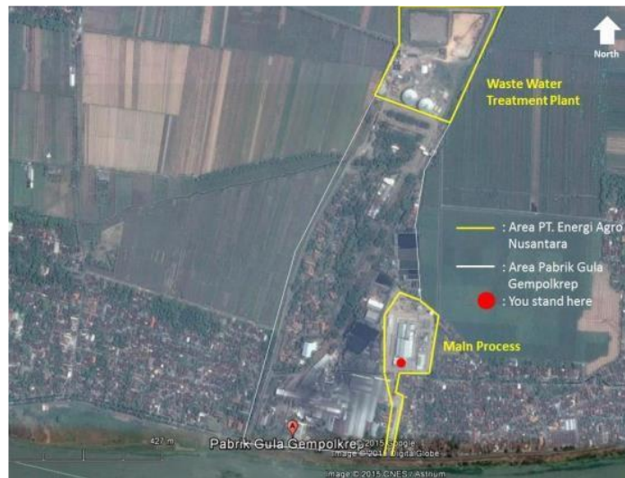
Gambar I. 2 Lokasi PT. Energi Agro Nusantara

PT. Energi Agro Nusantara berlokasi di daerah Gempolkrep, Mojokerto, Jawa Timur dengan luas lahan sekitar 6,5 hektar. Lokasi pabrik ini dipilih berdasarkan pertimbangan dari beberapa faktor sebagai berikut: