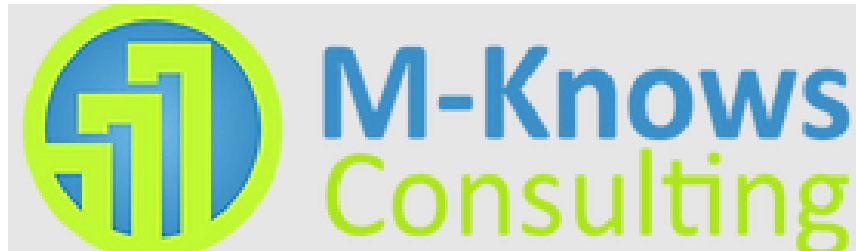
Gambar 2.1 Logo M-Knows Consulting

PT. Menara Indonesia atau yang lebih dikenal dengan nama M-Knows Consulting merupakan perusahaan yang bergerak dalam bidang Consultant Management dan Public Relation yang didirikan pada tahun 2003. Kantor yang berpusat di Jakarta dan telah memiliki cabang di Tangerang Selatan dan Surabaya. M-Knows Consulting telah sukses bekerjasama dengan berbagai perusahaan yang memiliki kualitas kerja yang memuaskan, sesuai dengan keahlian, dan berpengalaman dalam mengelola beragam kegiatan Public Training , In-House Training , dan Outbound & Team Building .