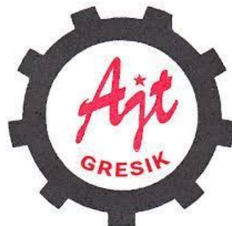
Gambar 2. 2 Logo Perusahaan PT. Aneka Jasa Teknik Gresik.