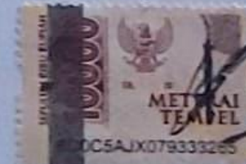
Shila Ardy Pratama

Surabaya, 22 April 2024 yang menyatakan,