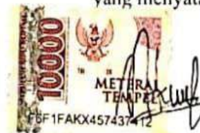
Nuril Ade Pramudita