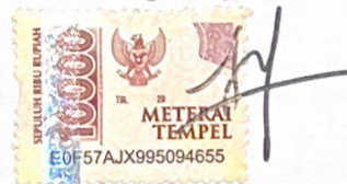
Gardenia Try Puspitaningtyas