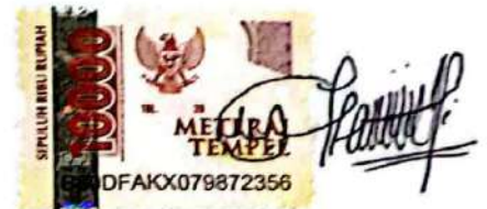
Nur Laeli Indarwati