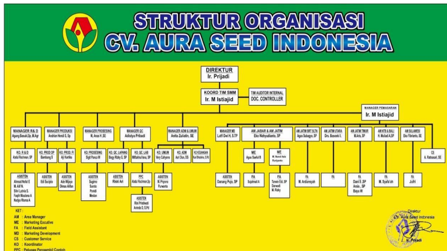
Gambar 3. 2 Struktur Organisasi CV. Aura Seed Indonesia